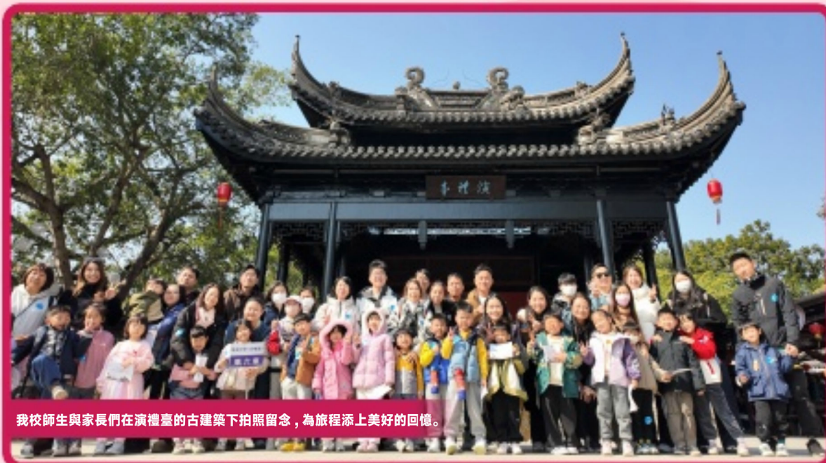
我校師生與家長們在演禮堂的古建築下拍照留念，為旅程添上美好的回憶。