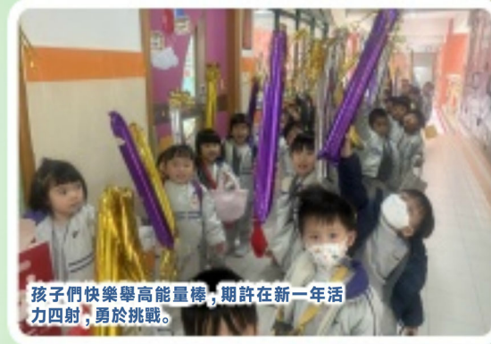
孩子們快樂舉高能量棒，期許在新一年活力四射，勇於挑戰。