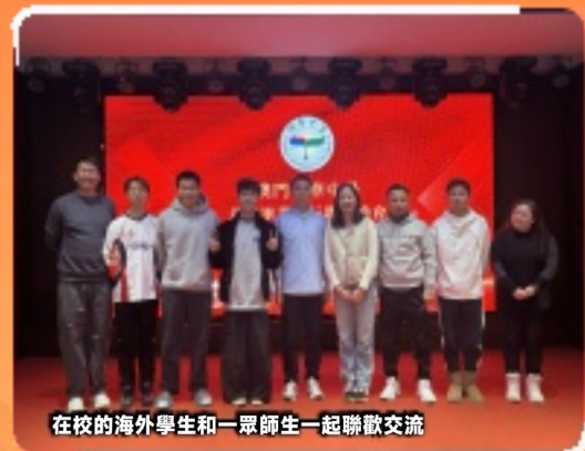
在校的海外學生和一群師生一起聯歡交流