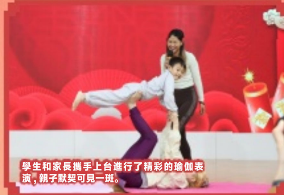
學生和家長攜手上台進行了精彩的瑜伽表演，親子默契可見一斑。