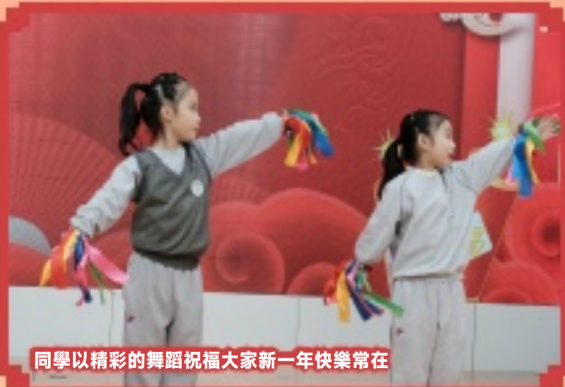
同學以精彩的舞蹈祝福大家新一年快樂常在