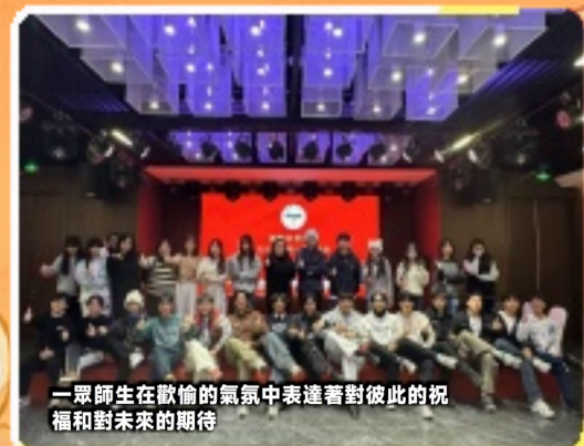
一群師生在歡愉的氣氛中表達著對彼此的祝福和對未來的期待