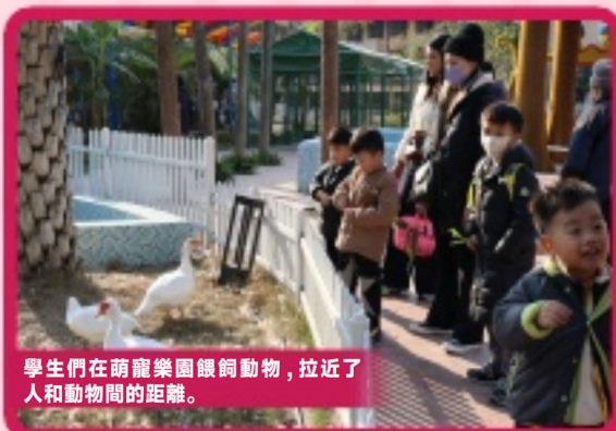
學生們在萌宠樂園餵飼動物，拉近了人和動物間的距離。