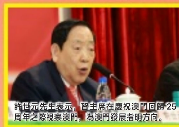
許世元先生表示，習主席在慶祝澳門回歸25周年之際視察澳門，為澳門發展指明方向。

與會師生紛紛表示要深刻領會習近平主席重要講話精神，把思想和行動貫徹到習近平主席重要講話精神上，以實幹譜寫奮鬥新篇章！