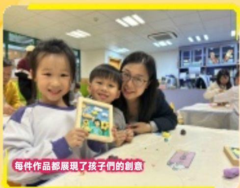
每件作品都展現了孩子們的創意