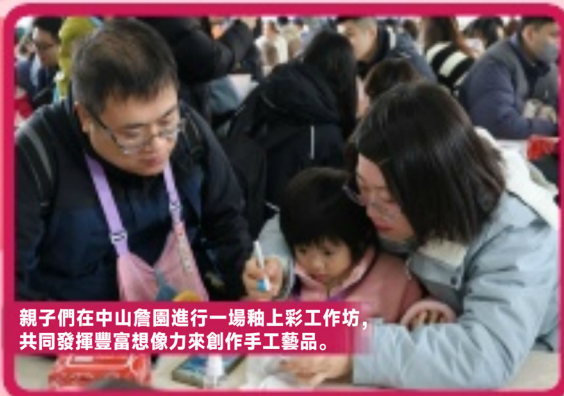
親子們在中山詹園進行一場釉上彩工作坊，共同發揮豐富想像力來創作手藝品。