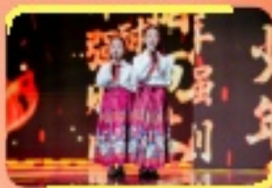
我校合唱團代表以歌聲唱好少年聲音