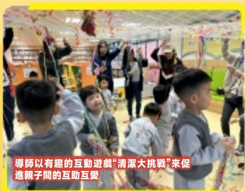
導師以有趣的互動遊戲“清潔大挑戰”來促進親子間的互助互愛