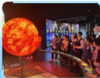
同學們認真聆聽中國航太技術和發射系統的發展歷程