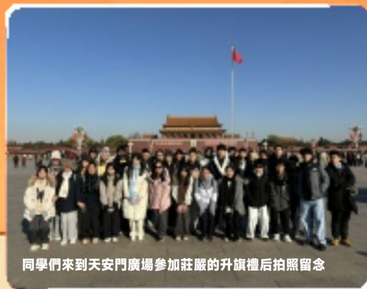
同學們來到天安門廣場參加莊嚴的升旗禮后拍照留念