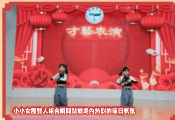
小小女團雙人組合瞬間點燃場內熱烈的節日氣氛