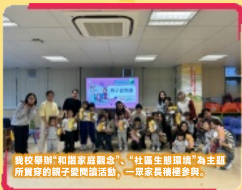
我校舉辦“和諧家庭觀念”、“社區生態環境”為主題所貫穿的親子愛閱讀活動，一眾家長積極參與。

本次活動不僅增進了親子感情，讓孩子與家長在歡樂中共同體驗閱讀的快樂，同時進一步讓更多的孩子愛上閱讀。