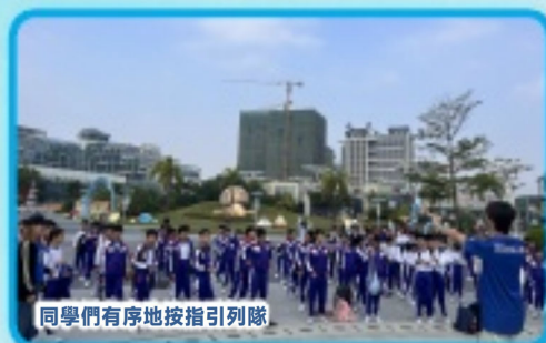
同學們有序地按指引列隊。

12月6、7日，我校小六級同學們迎來了他們期盼已久的兩天一夜的畢業旅行——橫琴星樂度戶外歷奇研學活動。活動期間，同學們勇於接受各項團體遊戲的挑戰，不僅增強了團隊的意識，而且提高了面對逆境的能力。