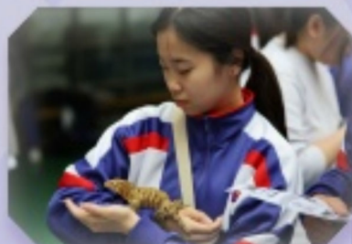
把生物科常見的爬蟲類動物呈現於同學們面前，令人眼前一亮。