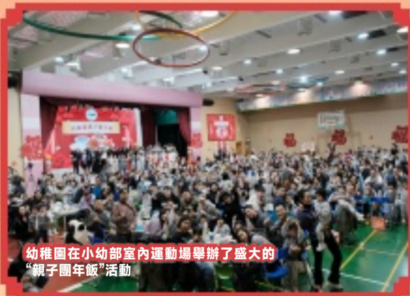
幼稚園在小幼部室內運動場舉辦了盛大的“親子團年飯”活動