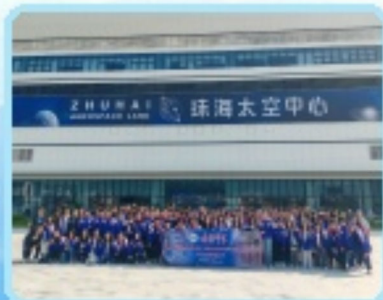
一眾師生前往珠海太空中心參觀