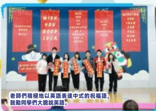
老師們積極地以英語表達中式的祝福語，鼓勵同學們大膽說英語。