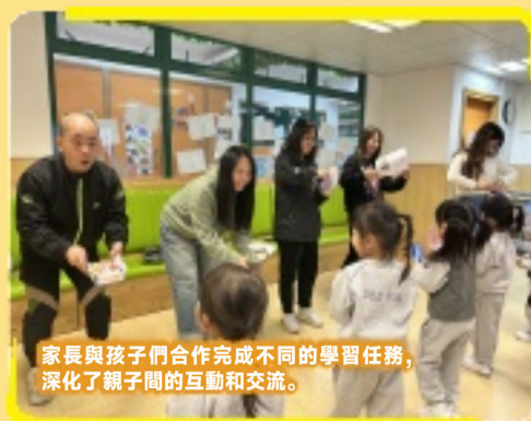
家長與孩子們合作完成不同的學習任務，深化了親子間的互動和交流。