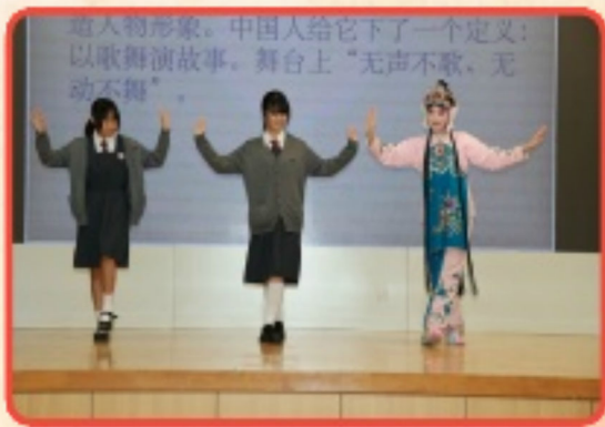
同學們在演員的指導下學習擺弄手勢和模仿步伐

本次京劇進校園活動，宛如一場文化甘露，不但豐富了校園文化生活，還讓學生更加直觀地感受到了京劇的魅力，拉近了戲曲藝術與學生的距離。同學們在接受傳統文化薰陶的同時，也增進了對傳統文化的熱愛。