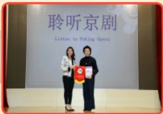
孫詠雅副校長與京劇團代表互送紀念品