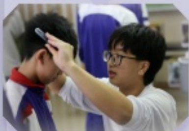
各小攤主用心地向同學們介紹不同的科技器材，提高體驗感受。