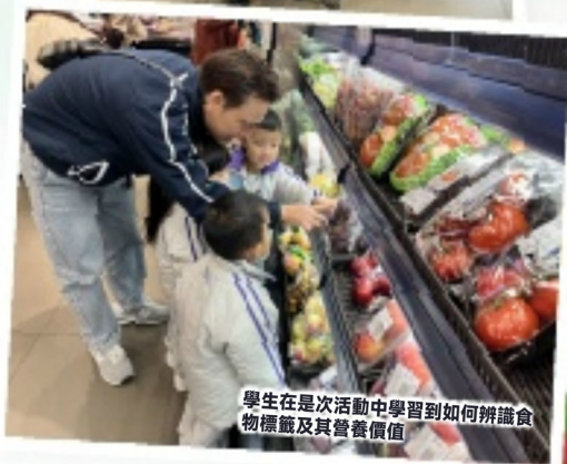
學生在是次活動中學習到如何辨識食物標籤及其營養價值