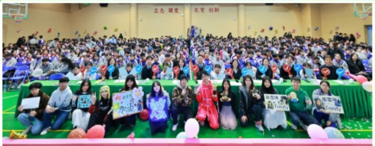
全體行政和師生們共同合照，留下美好的回憶。