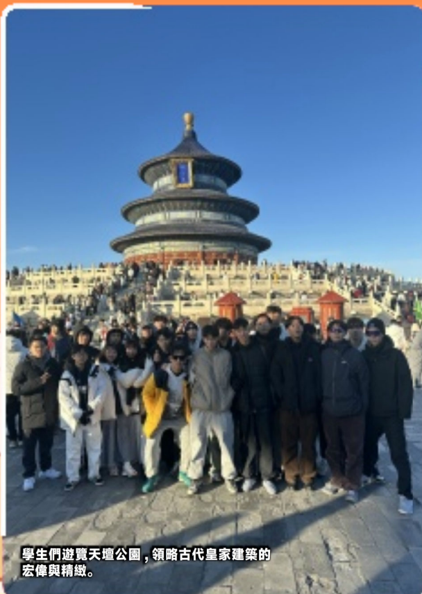
學生們遊覽天壇公園，領略古代皇家建築的宏偉與精緻。

這次“北京五天愛國學習之旅”是一次非常有意義的旅行。它不僅讓學生們瞭解了祖國的歷史文化和發展成就，更激發了他們的愛國熱情。隨著高三級學生們回到澳門，這次“北京五天愛國學習之旅”也圓滿落幕。這次旅行不僅讓學生們收獲了知識和友誼，更讓他們對祖國的未來發展充滿了信心和期待。同學們定會將這段經歷作為人生中的寶貴財富，銘記在心，激勵自己在未來的道路上不斷前行。相信在未來的日子裡，他們一定會用自己的實際行動，為實現中華民族的偉大復興貢獻自己的力量。