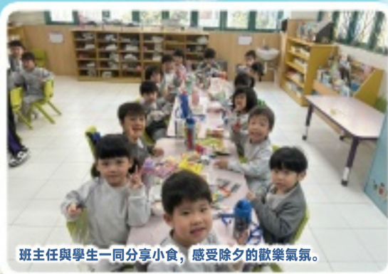
班主任與學生一同分享小食，感受除夕的歡樂氣氛。

班主任與學生一同分享小食，感受除夕的歡樂氣氛，並帶著對未來的美好期許，一起迎接 2025 年的到來，隨後老師與學生一同製作開心正能量棒，寓意新的一年充滿正能量，活力滿滿，新一年將“手握希望，心懷夢想”開啟新篇章！