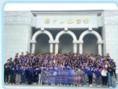
全體師生在孫中山紀念館前拍照留念