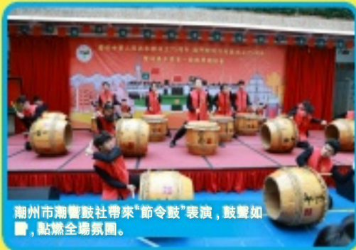
潮州市潮響鼓社帶來“節令鼓”表演，鼓聲如雷，點燃全場氛圍。