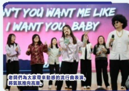
老師們為大家帶來動感的流行曲表演，將氣氛推向高潮。