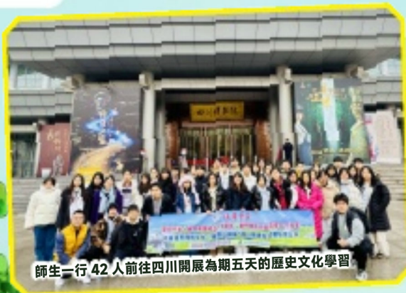
師生一行 42 人前往四川開展為期五天的歷史文化學習

培華師生們首先前往都江堰熊貓苑基地擔任大熊貓保育義工，並在天府勤耕博覽園體驗小農夫的生活，接著參觀了世界著名的都江堰水利工程，深入了解其悠久的歷史和卓越的水利技術。隨後師生們前往成都武侯區玉林老年院舍向老人們送上慰問和關懷，藉澳門回顧祖國廿五周年之際獻唱《七子之歌》，並向武侯區玉林老年院舍的老人們贈送富有培華特色的禮品。此外，師生還觀賞了非遺文化國粹“川劇變臉”，深刻感受到傳統文化的厚重底蘊。