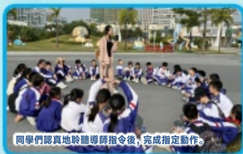
同學們認真地聆聽導師指令後，完成指定動作。

本次活動，不僅讓學生對團隊活動產生興趣，也提升他（她）們的執行力和解決問題的能力，更從中學會切身體會“換位思考”，瞭解建立包容、謙讓的和諧文化的重要性；同時，活動進一步增強了同學們的溝通和交流的能力，拉近了彼此間的距離。