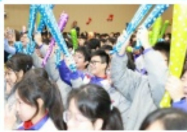
同學們為一眾心儀選手落力打氣