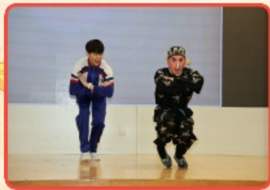
專業的京劇演員們帶領同學一起展示功架