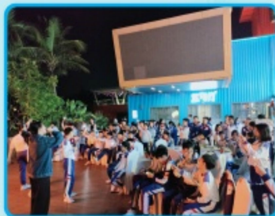
晚上的節目表演，歌聲、笑聲響徹全場。