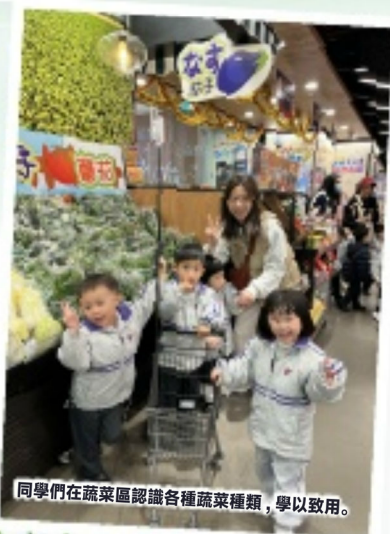
同學們在蔬菜區認識各種蔬菜種類，學以致用。