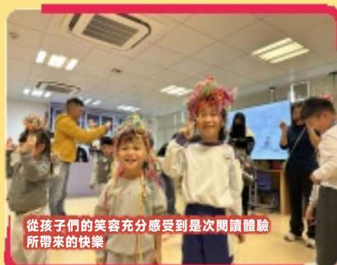
從孩子們的笑容充分感受到是次閱讀體驗所帶來的快樂