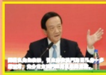
劉藝良先生表示，習主席在澳門期間出席十多場活動，充分肯定澳門回歸以來的成就。