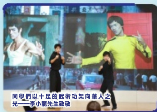
同學們以十足的武術功架向華人之光——李小龍先生致敬

為提升學生綜合能力，豐富校園文化生活，英語科組成功舉辦“2024 年度英語話劇比賽”。此次比賽以推廣中國傳統文化為話劇題材，成功激發同學們學習英語的樂趣。