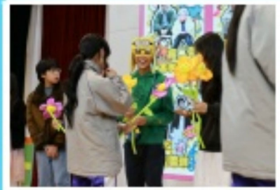
同學們為心儀的選手送上神聖的一票