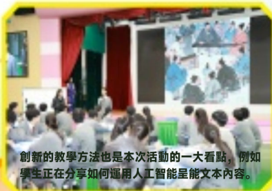
創新的教學方法也是本次活動的一大看點，例如學生正在分享如何運用人工智能生成文本內容。