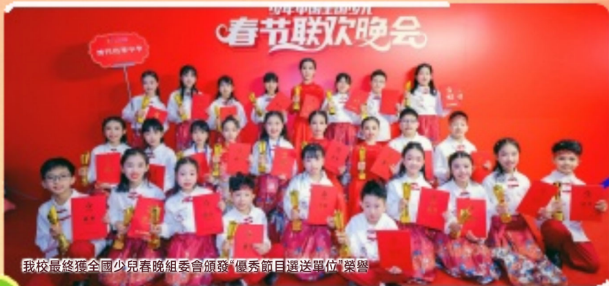
我校最終獲全國少兒春晚組委會頒發“優秀節目選送單位”榮譽