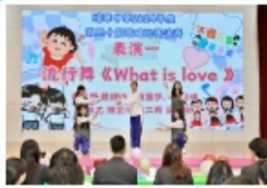
精彩的流行舞蹈表演