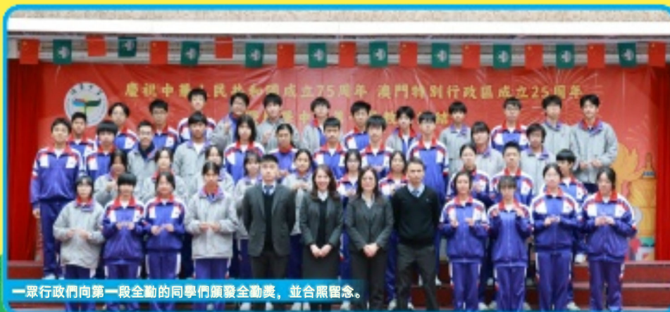
一眾行政們向第一段全勤的同學們頒發全勤獎，並合照留念。