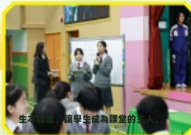
生本實踐，讓學生成為課堂的主體。