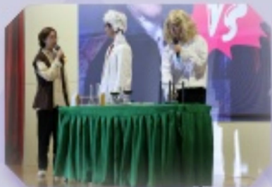
透過話劇的方式，深入淺出地向同學們介紹歷史人物的經典故事。