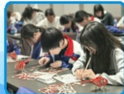
同學們充份發揮思考與實踐能力