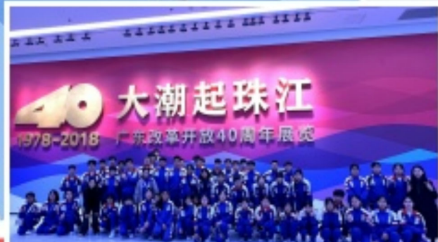
師生們在深圳改革開放展覽館瞭解了中國改革開放的輝煌歷程