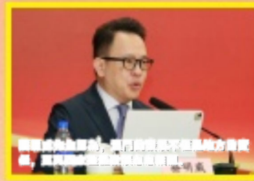
劉雅煌先生表示，習主席多次來澳，足見習主席對澳門的肯定與期許。