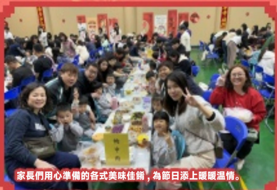
家長們用心準備的各式美味佳餚，為節日添上暖暖溫情。