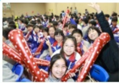
師生們興奮地投入於此次歌唱比賽之中，打氣聲音此起彼落。