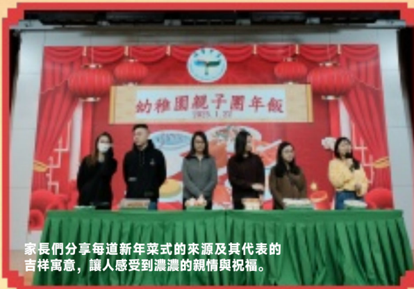
家長們分享每道新年菜式的來源及其代表的吉祥寓意，讓人感受到濃濃的親情與祝福。