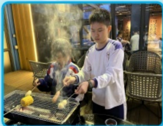
同學們用心地烤製食物，體驗燒烤活動所帶來的樂趣。