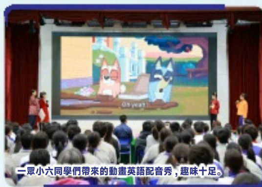
一眾小六同學們帶來的動畫英語配音秀，趣味十足。