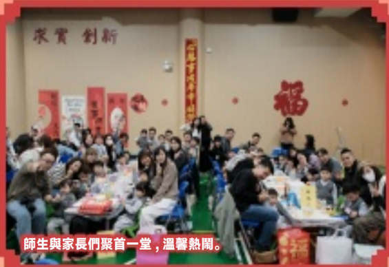
師生與家長們聚首一堂，溫馨熱鬧。