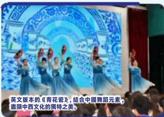
英文版本的《青花瓷》，結合中國舞蹈元素，盡顯中西文化的獨特之美。