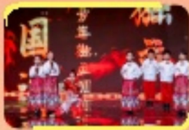
我校武術學生聯合演出了精彩又富有童真的“中國少年說·聲舞乾坤”節目