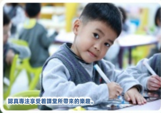
認真專注享受着課堂所帶來的樂趣。