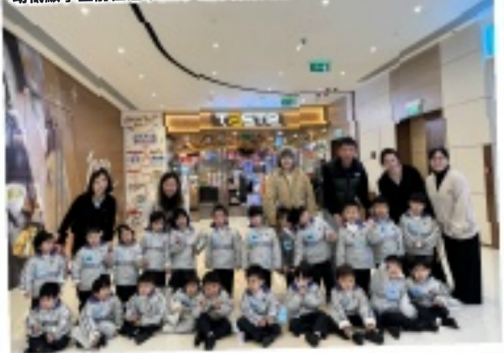
幼低級學生前往超市展開“超市探索之旅”