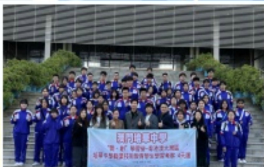
老師帶領職業教育班的同學前往深圳大學參觀及開展研學活動

在“中國油畫第一村”——深圳大芬油畫村，師生們近距離欣賞了各種風格的油畫作品，感受了藝術創作的魅力；在深圳美術館和深圳當代藝術與城市規劃館，大家進一步領略了藝術與城市規劃的交融之美，深化了對空間美學的認識。在隨後的深圳大學交流活動中，師生們不僅參觀了現代化的校園設施，還與該校相關專業師生進行了學術交流，共同探討室內設計的發展趨勢與創新理念。接著，深圳珠寶博物館的參觀更是讓學生們大開眼界，不僅學習了珠寶設計與製作的相關知識，更了解珠寶行業背後的文化與歷史。此外，師生們還遊覽了錦繡中華民俗村，感受了中國傳統文化的豐富多彩。師生們在深圳改革開放展覽館了解中國改革開放的輝煌歷程，激發了他（她）們對時代變遷中設計創新重要性的思考。