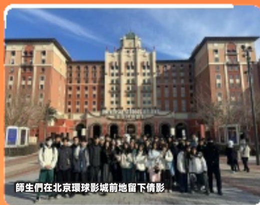
師生們在北京環球影城前地留下倩影