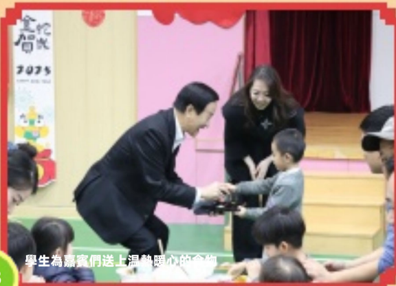
學生為嘉賓們送上溫馨暖心的食物