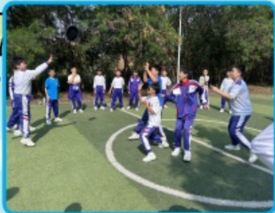
同學們積極投入以保衛家園為主題的飛盤活動，體會合作帶來的喜悅。