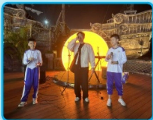
同學們大方自信上台表演歌藝