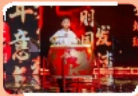
同學以激昂的敲擊節奏，奏響少年強則國強的青春力量。