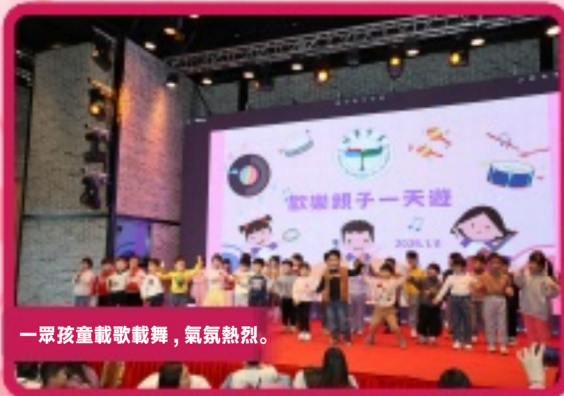
一眾孩童載歌載舞，氣氛熱烈。

行程首站來到中山詹園，安排一場釉上彩工作坊，家長和孩子一起發揮豐富想像力，創作充滿童趣和色彩斑斕的手工藝品，其後，由導師帶領參觀園內中國古典園林特色建築及講述孝道傳承的文化，感受中國傳統文化與大自然的美景。下午到達香山小鎮，家長和孩子在戶外活動感受陽光，在園內無動力樂園盡情玩樂，在萌宠樂園近距離與動物接觸，共同享受了一段難忘的親子時光。