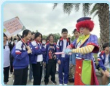
同學們認真欣賞造型氣球的技藝

此次活動，給同學們留下美好、難忘回憶的同時，也開拓了眼界，增長了知識。旅有所思，行有所獲，在歡聲笑語中，同學們結束了這次難忘的畢業旅行。