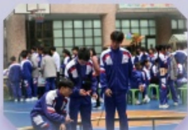
同學們積極地參與遙控四驅車為主題的科學活動，樂在其中。