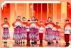
一眾學生昂然抖擻，展現童真活力。