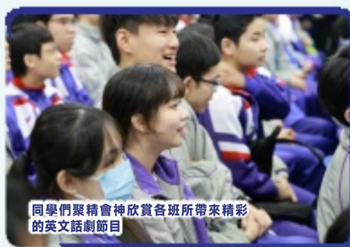
同學們聚精會神欣賞各班所帶來精彩的英文話劇節目