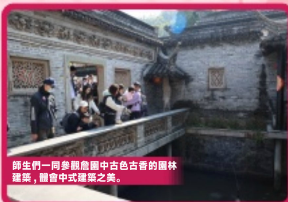
師生們一同參觀倉園中古色古香的園林建築，體會中式建築之美。