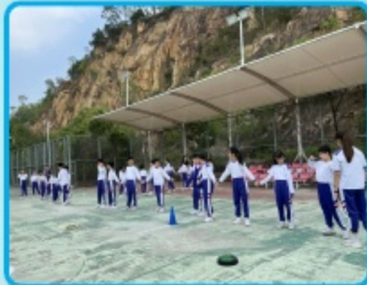
同學們在活動遊戲中實現溝通與互信，充份體驗團體合作的精神。