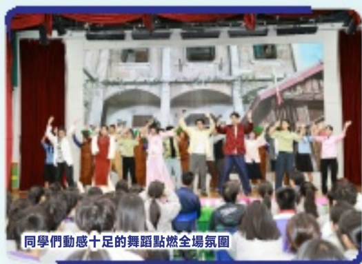
同學們動感十足的舞蹈點燃全場氛圍