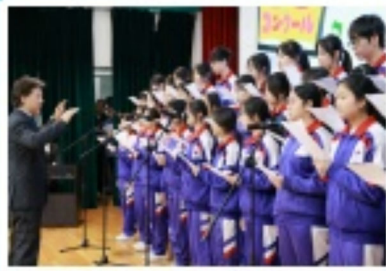
合唱團美妙的歌聲深深吸引台下觀眾們