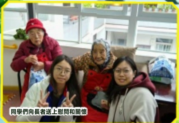
同學們向長者送上慰問和關懷