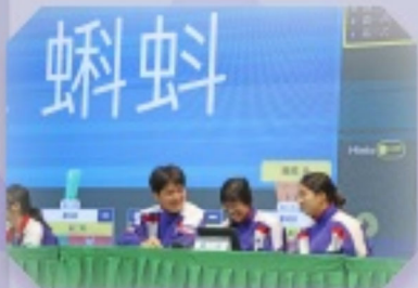
在數理競賽中，各小隊紛紛為得分展開激烈對決，獲分同學展開勝利的笑容。

各組及學會的緊密協作，使本次活動變得更精彩圓滿。精心設計的數理知識競賽環節，激發了同學們對數理知識的探索熱情；趣味十足的科普攤位，讓同學們直觀地瞭解到科學與日常生活的緊密聯繫。各科組及兩個學會的共同努力，讓這場活動成為了一場知識與趣味交融的盛宴，有力推動了校園科學文化氛圍。