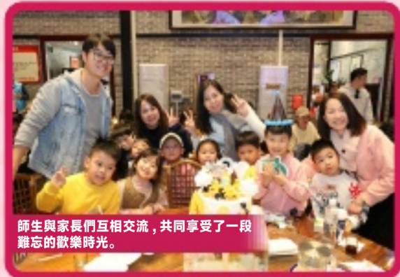
師生與家長們互相交流，共同享受了一段難忘的歡樂時光。