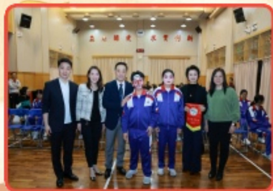
孫詠雅校長和京劇代表、參與同學一起合照