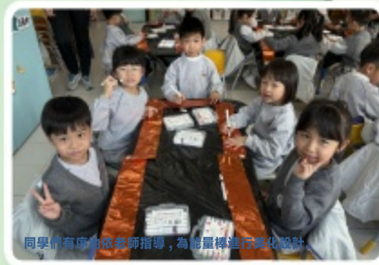
同學們有序地依老師指導，為能量棒進行美化設計。