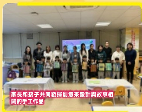
家長和孩子共同發揮創意來設計與故事相關的手工作品