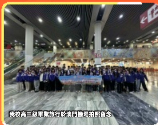
我校高三級畢業旅行於澳門機場拍照留念

第三天，同學們來到了北京環球影城，這裡是一個充滿奇幻與驚喜的世界。他們體驗了各種驚險刺激的遊樂設施，如哈利波特的魔法城堡、變形金剛的驚險之旅等，與心愛的角色合影留念，留下了許多美好的回憶。午餐時，他們在園區內的主題餐廳享用了美食，每一道菜都充滿了創意和驚喜。