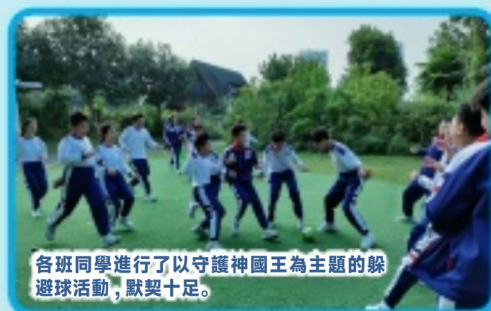
各班同學進行了以守護神國王為主題的躲避球活動，默契十足。