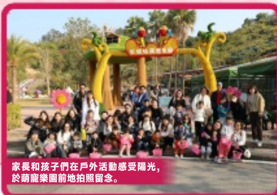
家長和孩子們在戶外活動感受陽光，於萌宠樂園前地拍照留念。