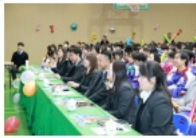
一眾行政們十分陶醉地欣賞各選手們的落力演出