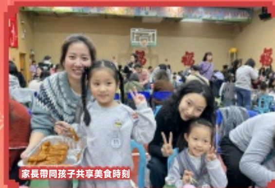
家長帶同孩子共享美食時刻