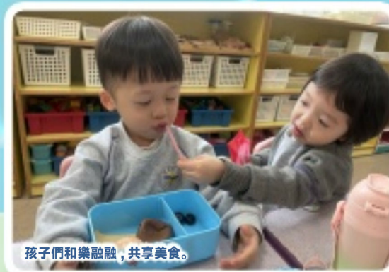
孩子們和樂融融，共享美食。