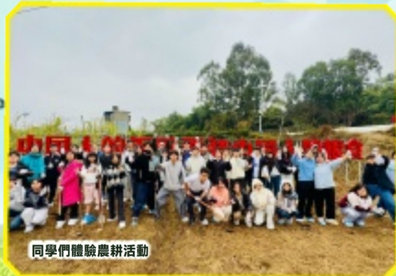
同學們體驗農耕活動