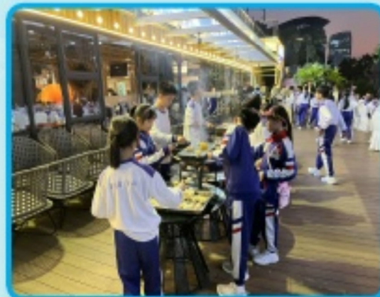
同學們一起享受燒烤美食，度過一個難忘的夜晚。