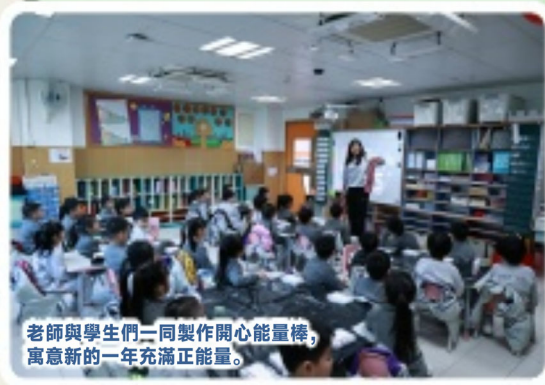
老師與學生們一同製作開心能量棒，寓意新的一年充滿正能量。