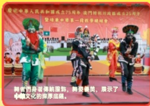
舞者們身著傳統服飾，舞姿優美，展示了中華文化的深厚底蘊。