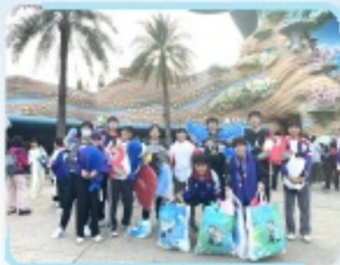
大家搜羅一眾紀念品為旅程留下滿滿的回憶