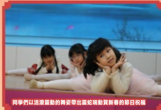
同學們以活潑靈動的舞姿帶出靈蛇瑞動賀新春的節日祝福