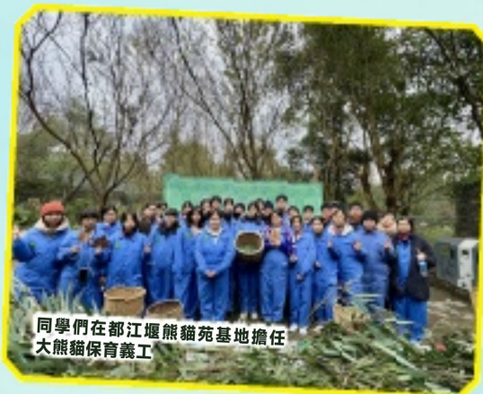
同學們在都江堰熊貓苑基地擔任大熊貓保育義工